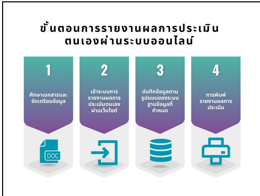
ภาพที่ 7.1 การรายงานผลการประเมินตนเองผ่านระบบออนไลน์